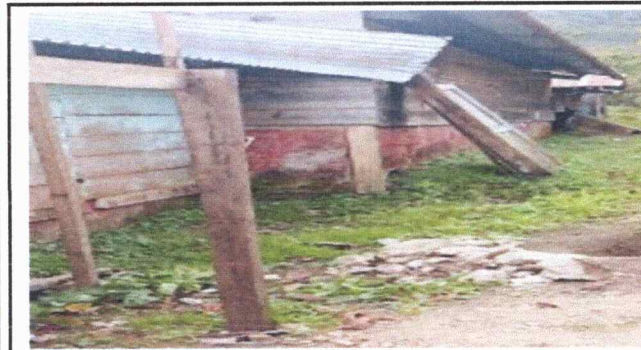
Foto 3: Se observa en area deterioro de la maderas en mal estado o desprendimiento de capote en modulo 3