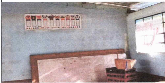
Foto1: Se observa el deterioro de la estructura portante, desprendimiento pintura en las paredes en el modulo 2