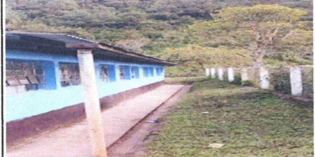
Foto 2 Se observa el deterioro de los canales de la escuela portante en el modulo 2