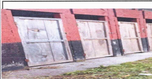
Foto 5: Se observa modulo de de baño de niñas, las puertas expuesto a la humedad